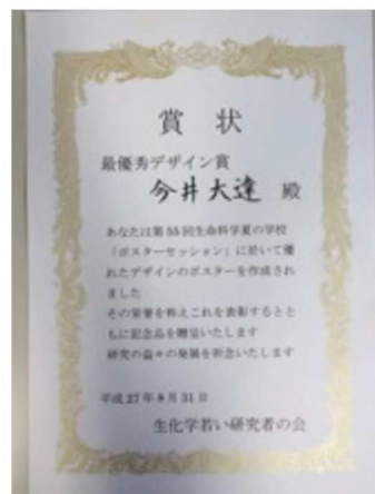
図 受賞したポスター（左）と表彰状（右）