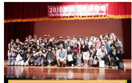
この写真は、2010年3月19日の成果発表会の様子です。

最初にプレイスメントテストで3つのクラスに分けられます。学生との交流も充実していて、しっかりと中国語を学べます。中原大学と台湾師範大学の場合は、新潟大生以外の方の受入れもしている混成プログラムです。5つのどの大学の場合も、中国語初級者から中級者向けのプログラムです。授業は主に中国語で行われ、会話・リーディング・ライティングなどを学びます。午前・午後に授業/文化体験が組まれており、チューターとの会話の時間も設けられているので、短期間でもきっちりと勉強をしたい方にお勧めのプログラムです。そのほか、文化体験として体験授業を通じて台湾文化に触れることができます。研修プログラムの最終週には、中国語で演劇を行う成果発表会や送別会なども設定されています。