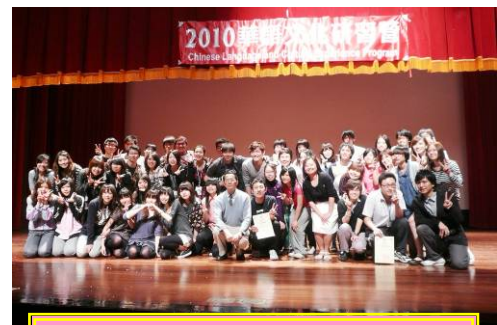
この写真は、2010年3月19日の成果発表会の様子です。

最初にプレイズメントテストで3つのクラスに分けられます。学生との交流も充実していて、しっかりと中国語を学べます。中原大学と台湾師範大学の場合は、新潟大生以外の方の受入れもしている混成プログラムです。6つのどの大学の場合も、中国語初級者から中級者向けのプログラムです。（もちろん、人数が少ない場合は、現地の先生と相談の上、通常の授業も聴講できるかもしれません。）授業は主に中国語で行われ、会話・リーディング・ライティングなどを学びます。午前・午後に授業/文化体験が組まれており、チューターとの会話の時間も設けられているので、短期間でもきっちりと勉強をしたい方にお勧めのプログラムです。そのほか、文化体験として体験授業を通じて台湾文化に触れることができます。研修プログラムの最終週には、中国語で演劇を行う成果発表会や送別会なども設定されています。