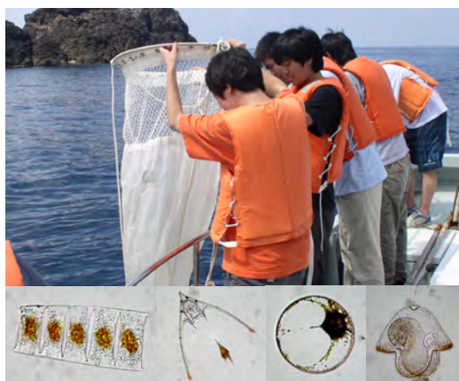
プランクトン採集