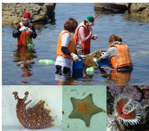
磯の生物のシュノーケリング観察