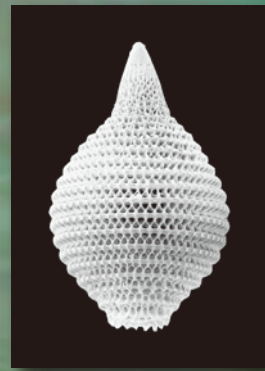
中生代放散虫化石ミリスス