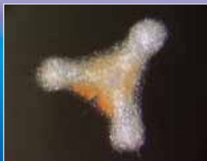
色のきれいな放散虫