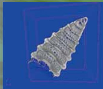
放散虫化石の断面