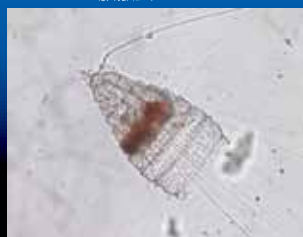
生きている放散虫