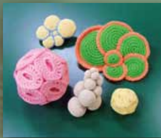
微化石編みぐるみ